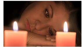
AVIOERO, OSITUS JA PARISUHDEVÄKIVALTA